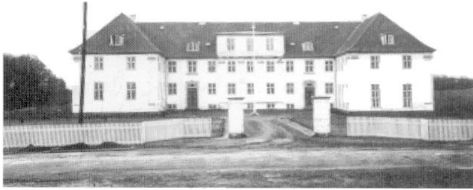
Det ferdige resultat (1923)