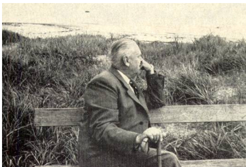
Går tankene mon fra Hou til Hillerød