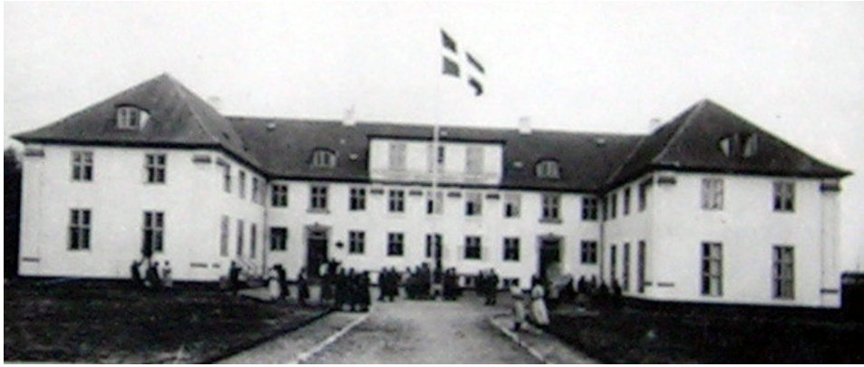
Det første elevkullet 1923